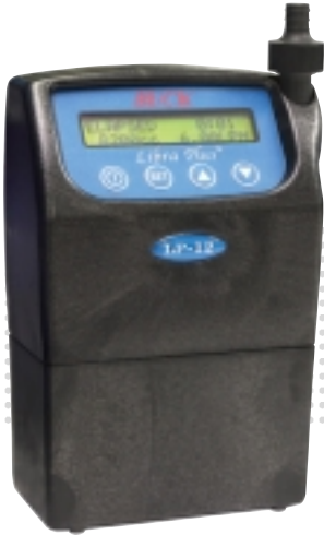
LP-12 3 ~ 12 l /min