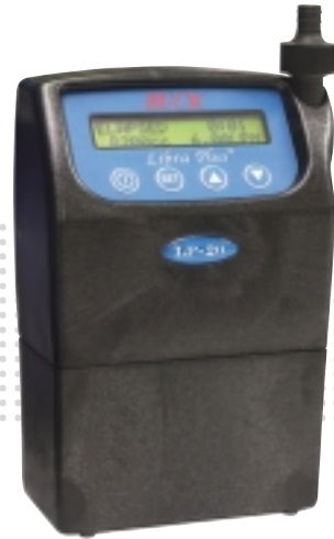
LP-20 5 ~ 20 l /min