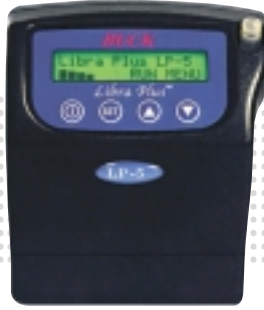
LP-5 0.8 ~ 5.0 l/min