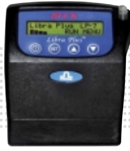
LP-7 3 ~ 7 l/min