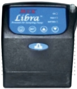
LP-4 0.8 ~ 4.0 l/min