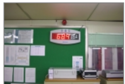
< 포스코건설 >