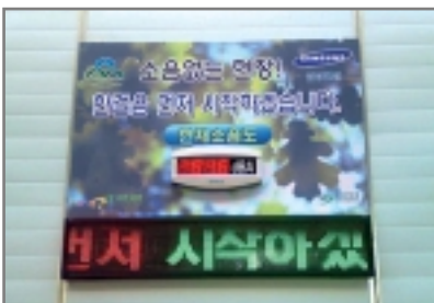
< 삼성건설 >