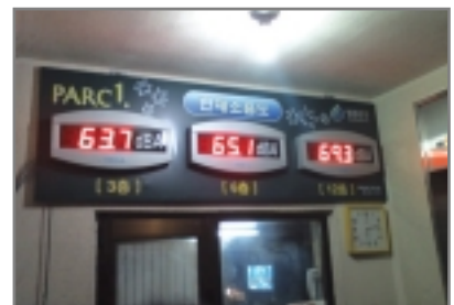
< 삼성건설 >