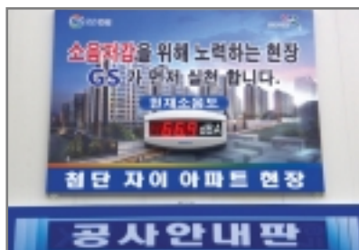
< GS건설 >