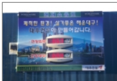
< 대우건설 >