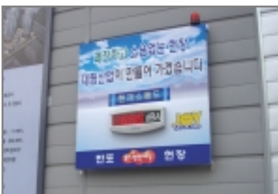
< 대림산업 >